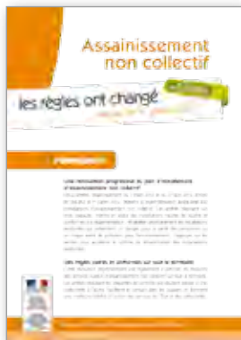
Assainissement non collectif Les règles ont changé depuis le 1 er juillet 2012 6 pages - octobre 2013