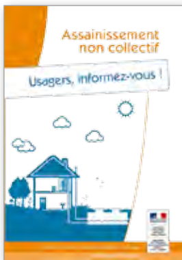
Assainissement non collectif Usagers, informez-vous ! 6 pages - octobre 2013