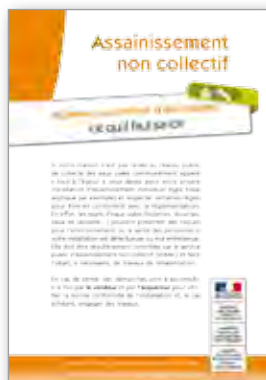
Assainissement non collectif Acheteurs ou vendeurs d'une maison, ce qu'il faut savoir 4 pages - octobre 2013